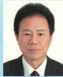
加西市長 西村和平氏