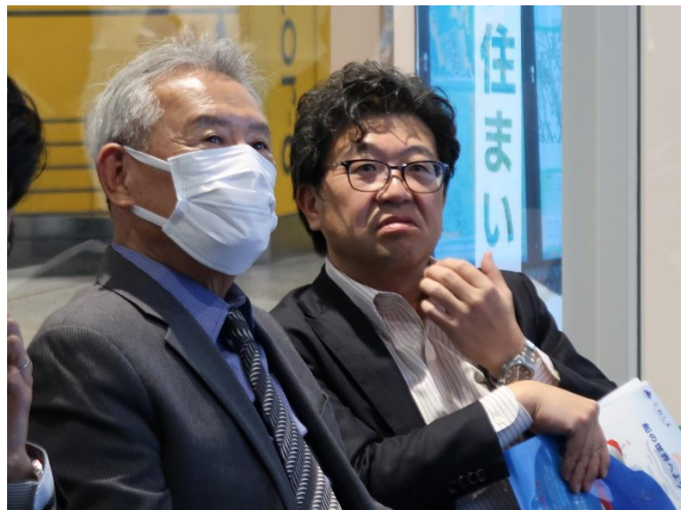
ファシリテーター 岡共同座長(左)と角南共同座長(右)