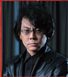
2025年日本国際博覧会 テーマ事業プロデューサー 石黒 浩 氏