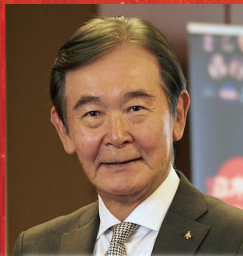
文化庁長官 都倉 俊一 氏